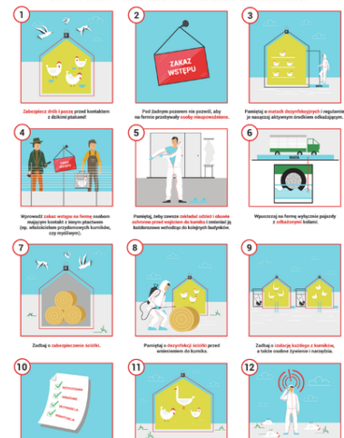
zasady bioasekuracji ulotka